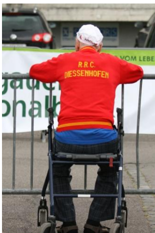
Hugo: langjähriger Helfer und aufmerksamer Zuschauer